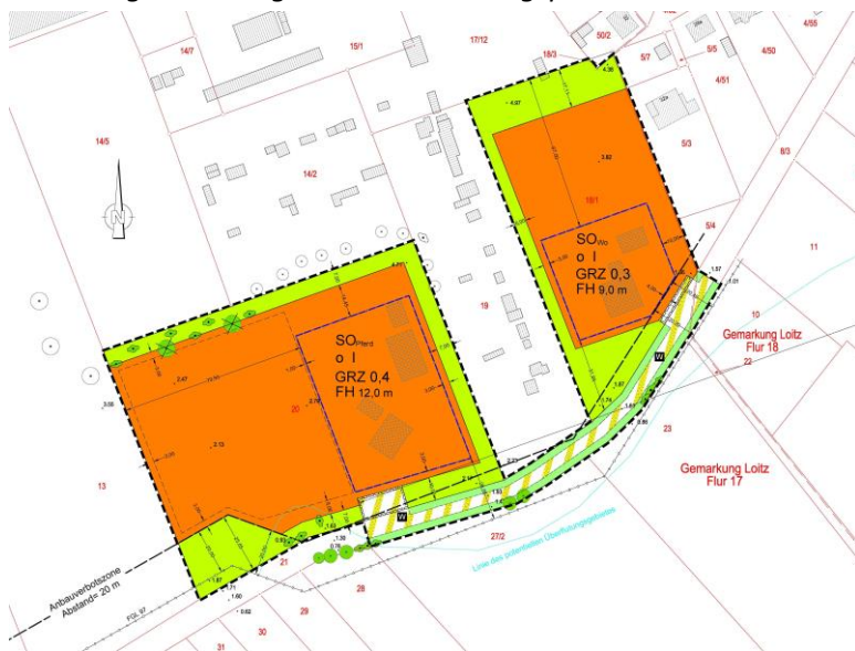
Abbildung 1: Geltungsbereich Bauungsplan Nr. 15

Der überbaubare Bereich befindet sich auf den Grundstücken 18/1, 20 und 21 in der Flur 17 der Gemarkung 133745/ Loitz.