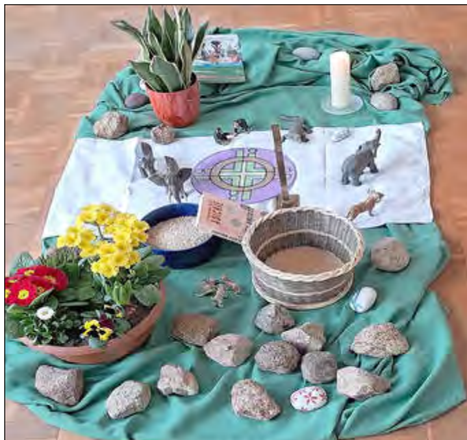
Feier des Weltgebetstages in Gülzowshof am 08.03.2026

Unsere Frühlingsmusik findet am Sonnabend , dem 25. April , um 17:00 Uhr in der Kirche von Trantow statt.