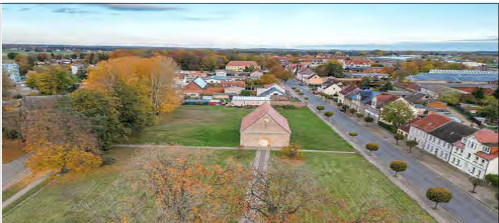
Lutherkirche von oben